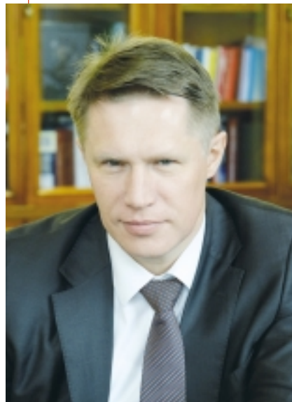
М.А. Мурашко, главный редактор журнала, руководитель Федеральной службы по надзору в сфере здравоохранения

Посвящая очередной номер нашего журнала проблеме совершенствования медицинской помощи больным с сердечно-сосудистыми заболеваниями, мы постарались дать не только общий статистический срез по заболеваемости взрослого населения, включая такой механизм выявления ССЗ, как диспансеризация, но и показать, как на региональном уровне решаются вопросы доступности кардиохирургической помощи, каковы перспективы трансляционных исследований в кардиологии и тенденции эндоваскулярной хирургии, а также затронуть вопросы импортозамещения медицинских изделий, использующихся в сердечно-сосудистой хирургии. Отдельное исследование, подготовленное по результатам контрольно-надзорных мероприятий Росздравнадзора, посвящено выполнению основных целевых показателей по снижению смертности от болезней системы кровообращения в субъектах Российской Федерации.